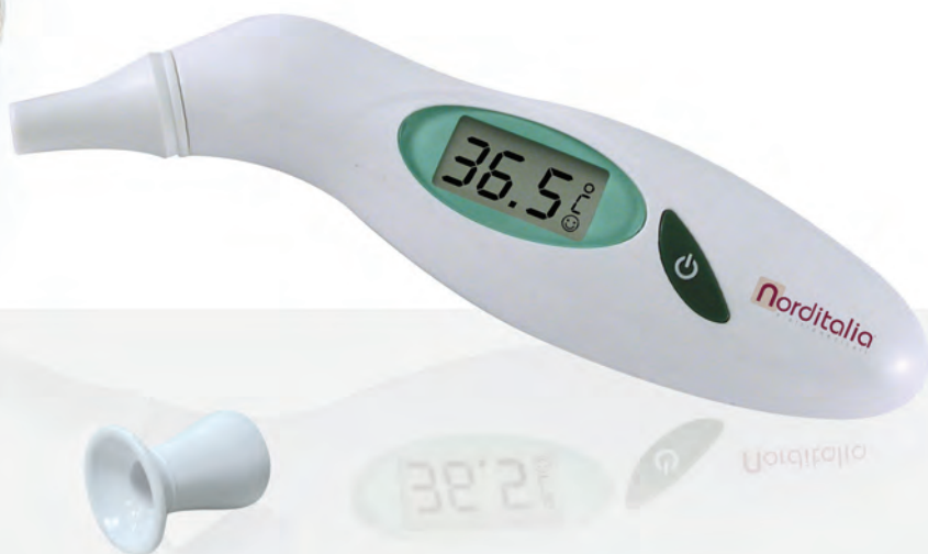
forehead adapter adattatore frontale