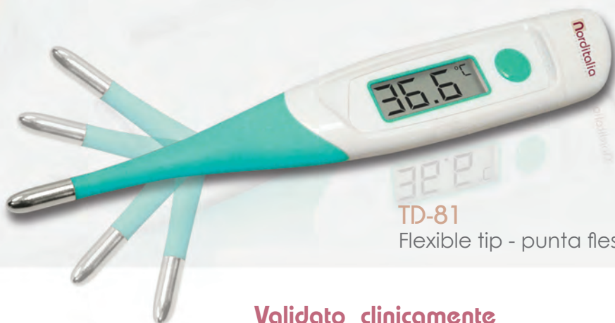
TD-81 Flexible tip - punta flessibile