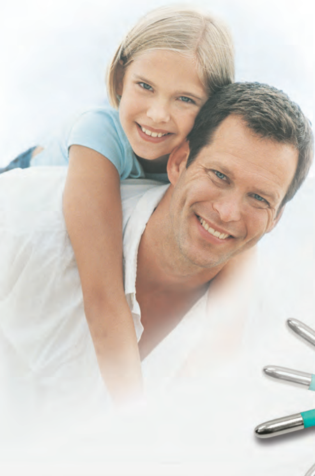
TD-20 Rigid tip - punta rigida